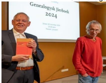
Tige tank, Ype, foar alles!