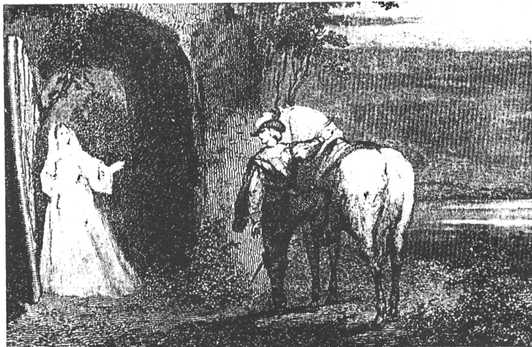
De Witte Poort. Jonker Tjaard neemt, na een nachtelijk bezoek, afscheid van zijn Aleid.

⊗ deze afbeelding behoort bij het "liefdesverhaal" op pag. 4, 5 en 6