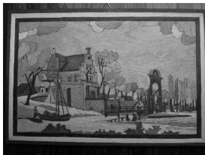
Afbeelding van Snekerpoort te Bolsward – tekening en intarsia schilderij

Met een zeer scherp stalen mesje wordt dan de vorm uitgesneden in het hout. Soms moet grote kracht worden uitgeoefend om door het hout heen te snijden waarbij wel eens een mesje kan breken! Met name eikenhout soorten en hardhout zijn keihard. De stukken worden dan met velpon aan elkaar gelijmd, totdat de plaat helemaal klaar is. De voorstelling wordt dan overgebracht en vastgelijmd op een houten paneel dat iets groter is dan de tekening, zodat er ook een lijst om de tekening kan worden geplaatst.